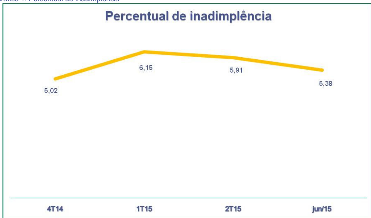
Gráfico 1: Percentual de Inadimplência

Com o objetivo de melhor expor a composição da carteira de crédito, mostramos na tabela 3 a segregação por faixas de atraso das operações de crédito ativas, além do montante de operações em dia e total bruto da carteira.